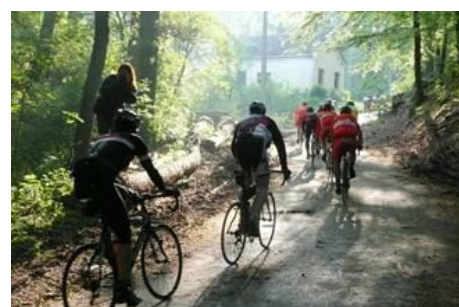
Tochten voor wielertoeristen Een gravelparkoers