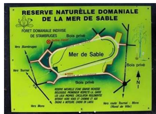
Een exceptionele doortocht in het park van het kasteel van Beloeil en de stands op de Mer de Sable in Stambruges