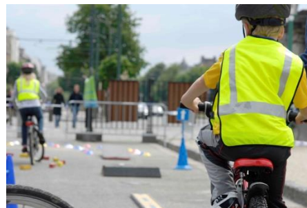
Animaties voor kinderen en families (hier Pro Velo) en stands

Een onvergetelijke en niet te missen dag onder vrienden of familie !